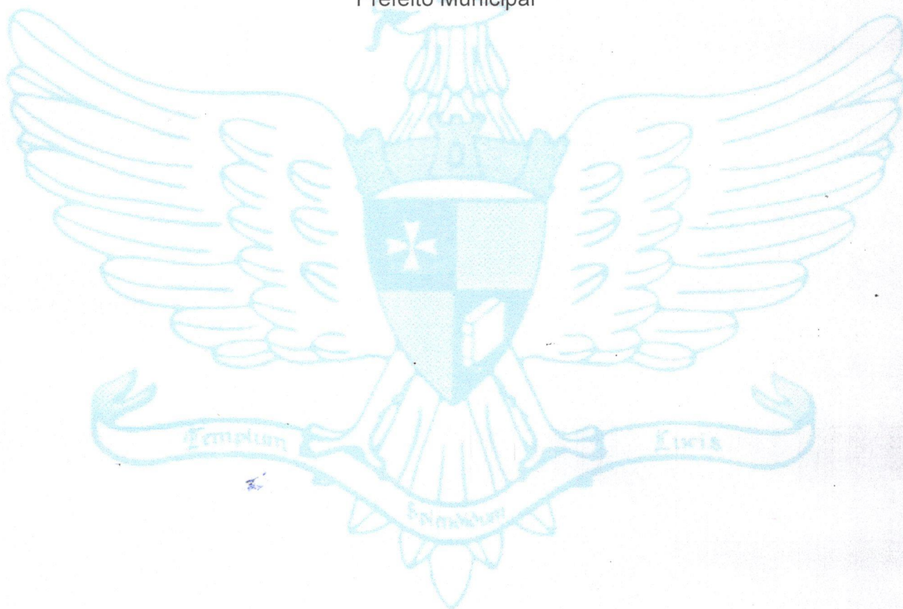
RAIMUNDO NONATO CARDOSO Prefeito Municipal